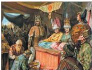
Руські князі в Орді. Сучасний малюнок

«Не личить держати нашу батьківщину крижевникам (хрестоносцям)», «Не дам півотчини своєї, але поїду до Батия сам»?