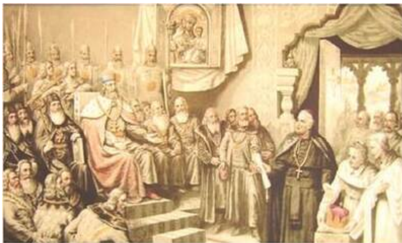
«Коронація Данила», художник Антон Пилиповський

«У той самий час прислав папа послів достойних, що принесли Данилові вінець, і скіпетр, і корону, які означають королівський сан, кажучи: “Сину! Прийми од нас вінець королівства” ...Пізо, посол папський, прийшов, несучи вінець і обіцяючи: “Ти матимеш поміч від Папи”».